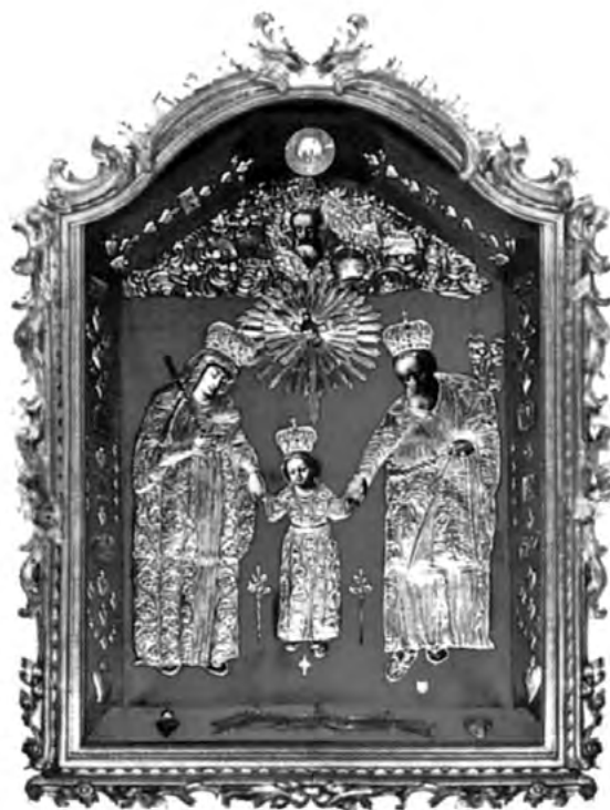
CUDOWNY OBRAZ ŚWIĘTEGO JÓZEFA W BAZYLICE KALISKIEJ Pl. Św. Józefa 7, 62-800 Kalisz tel. (062) 757 58 22

Święty Józef to niedościgły wzór życia rodzinnego, Jemu to od samego początku powierzyłam w opiekę swoją rodzinę. Nie pamiętam, aby ten Przczysty Oblubieniec Najświętszej Pani nie przyszedł mnie, czy moim bliskim z pomocą. Mogłabym dać wiele przykładów Jego orędownictwa, sięgając po listy umieszczone za obrazem. Jedno z tych nadzwyczajnych wydarzeń zasługuje na uwagę szczególną. Cofnę się więc kilka lat wstecz. Otóż, kończyliśmy z mężem przygotowywanie wieczerzy wigilijnej. Lada moment mieli przyjść do nas synowie z rodzinami, z małymi dziećmi, by wspólnie